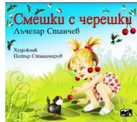
★ Сайт „Бивалици“ www.slance.eu