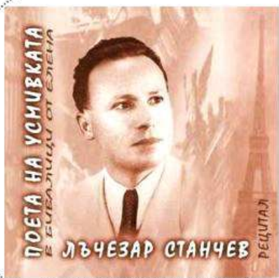
CD с рецитал и книга с „Бивалици“

Обявата е публикувана в Интернет, в „Труд“, в „Сега“, БТА, в „Литературен вестник“ и в „Словото днес“. ИК „Жанет 45“ подготвя стихосбирката „Капка“ от Лъчезар Станчев с избор и подредба от Светлозар Игов.