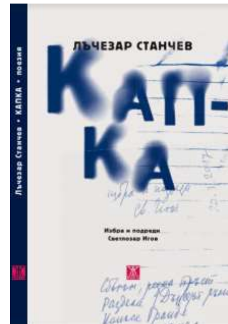
„Капка“, Избра и подреди Светлозар Игов, ИК Жанет45, 2018 г.